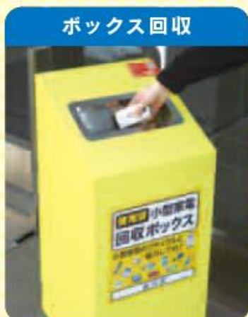
ボックス回収 公共施設やスーパー、家電小売店などに専用の回収ボックスを設置し、回収します。