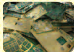
有用金属が含まれている電子基板

小型家電には、鉄、アルミ、金、銀、銅、レアメタルといった有用な金属が含まれています。日本で1年間に使用済みとなる小型家電は 65万トン にもなります。そのうち有用な金属は28万トンで、金額にすると 844億円分 にもなります。一方で、小型家電は鉛などの有害な物質を含むものもあるため、適正な処理が必要です。しかし現在は、鉄などの一部の金属を除いて、その大半が廃棄物の埋立地に処分されています。また、違法な廃棄物回収業者を通じて国内外で不適正な処分が行われているものもあります。