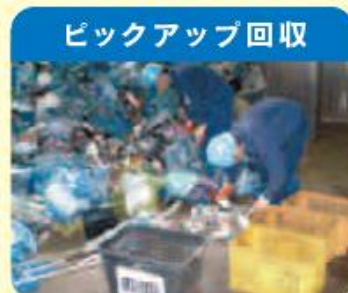
ピックアップ回収 粗大ごみや不燃ごみと一緒に回収し、ごみ処理施設で自治体の職員が小型家電を取り出します。