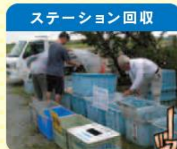
ステーション回収 ごみ回収の区分に、新たに「小型家電」を設けます。