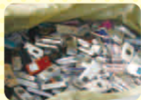
使用済みになった携帯電話