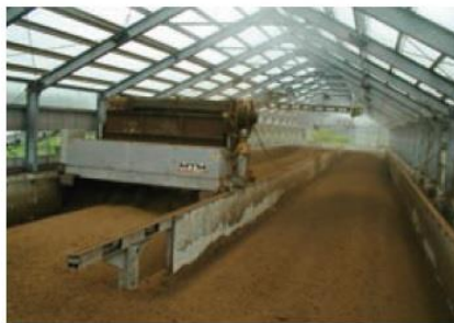
堆肥化・飼料化・油脂化