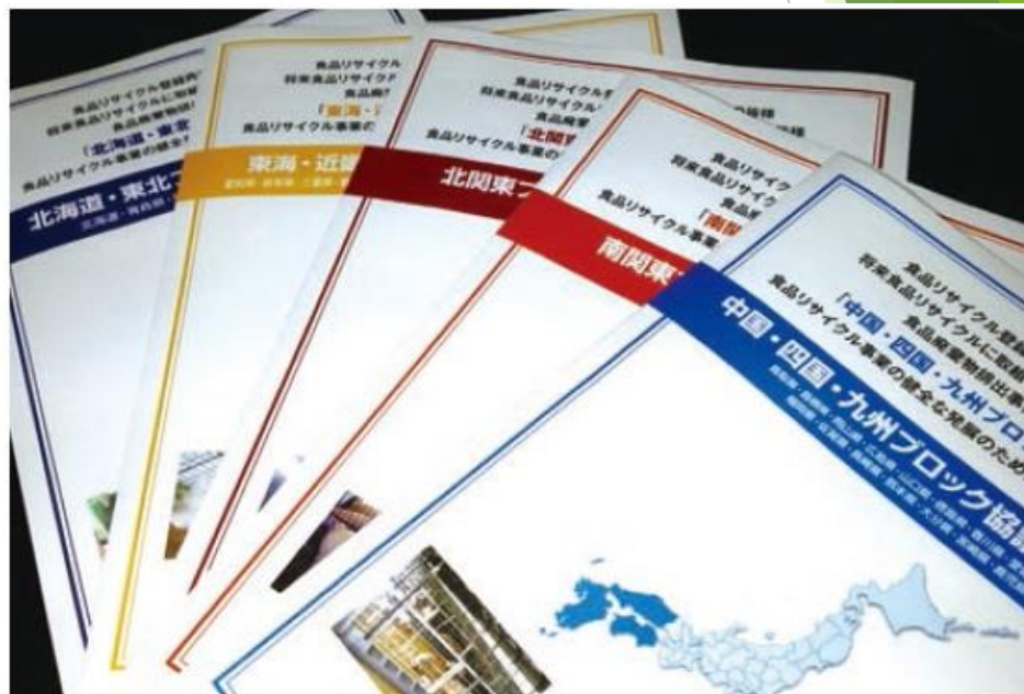
地域ブロック協議会パンフレットの作成